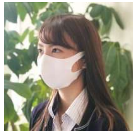
写真イメージ：マスク（左）、マスク装着イメージ（右）

日本政府より 2020 年 2 月 28 日に発せられた全国の小中高校を対象とした休校要請や 4 月 7 日の緊急事態宣言後も、全国の保育施設は稼働しています。また、新型コロナウイルスの感染拡大が続く中、社会インフラの一部として、小さな子どもたちの安全と安心を守り続ける保育施設では、保育士をはじめとする保育現場スタッフの精神的、肉体的疲労も積み重なってきています。